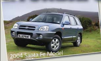
2004 Santa Fe Model